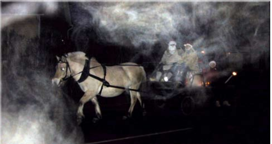
2001 kom tomten med häst och vagn till torget

Sist skulle jag vilja göra lite reklam för de träffar som under våren kommer att ge den som vill information om Skäldervikens historia. Bland annat kommer badlivet, byns historia och utveckling att berättas om genom fotografier och olika personers erfarenheter. Det kommer att bli tre träffar med mycket intressanta historier. Jag hoppas att vi ses!