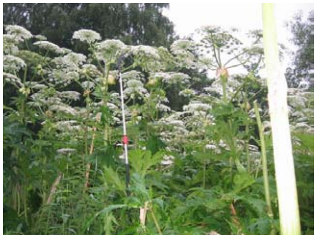
Fyra meter höga bestånd vid Käggleån