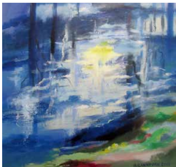
Runes konstverk innehåller natur, hav och fria fantasier. Ett skapande med mycket känsla.