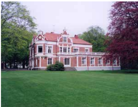
Egendomen Valhalls corp de logi.

tilltalande som möjligt. Det finns goda exempel på att ny bebyggelse i ett litet samhälle kan bli lyckat. Victoria Strand på f.d. KVS-området i Vejbystrand är ett bra exempel. Bland oss 70-plussare är det troligen många som vill bo kvar i Skälderviken så länge som möjligt och skulle välkomna ett seniorboende i Valhallsskogen när vi inte längre orkar med våra hus och trädgårdar.