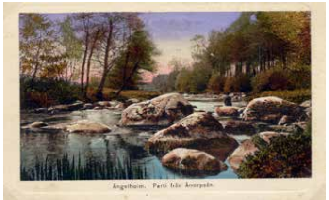
Ängelholm. Parti från Åkerupån.

Valballskonsortiets ägor begränsades i söder av Rössjöholmsån.