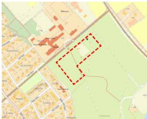
Översiktskarta över område utpekad i planansökan (streckad linje).

På senare tid har kritik mot byggplanerna varit det stora huvudnumret. Även kommunen har tidigare varit negativ till byggnation i skogen men har nu ändrat sig och påbörjat arbetet med detaljplanen. Att en liten del av skogen mitt emot Errarps skola nu är aktuell för några bostadshus och ev. en förskola är ett marginellt intrång i skogen. Som boende i Skälderviken är jag självfallet intresserad av att detta projekt blir så bra och