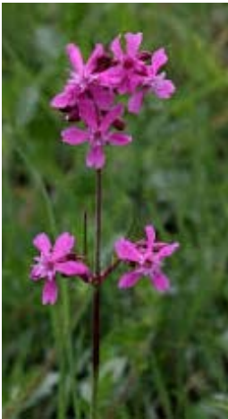
Tjärblomster dominerade helt på Lövängen i våras.