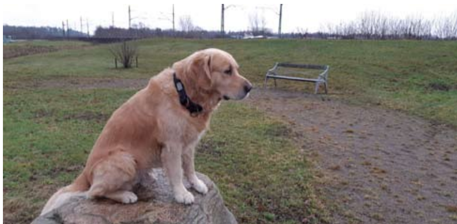
Bamse ser lite ledsen ut.