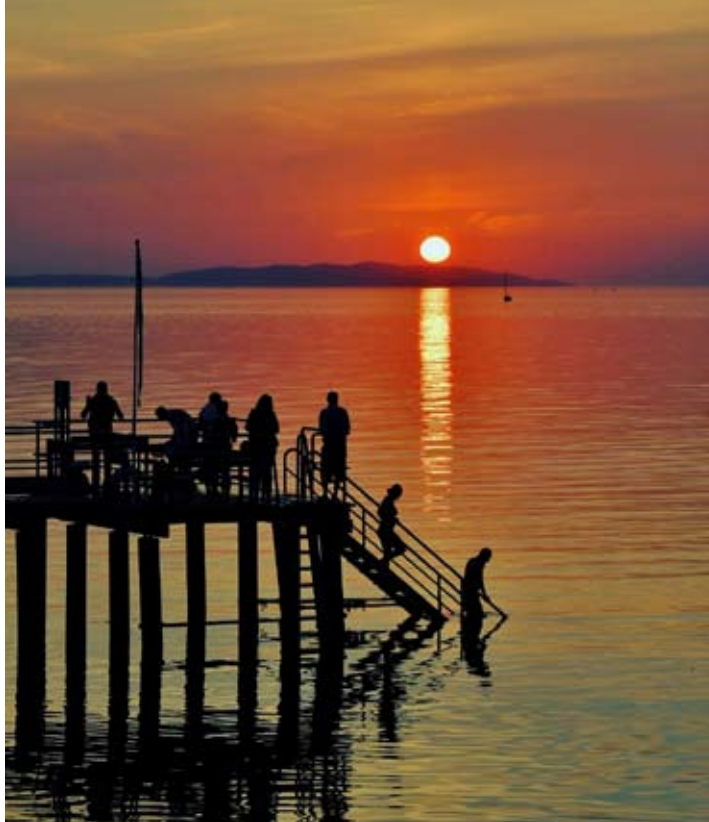
Solnedgång över Skälderviken tisdagen den 15 september 2020.

Slutet av sommaren förgylldes med en badflotte till mångas glädje. Till nästa säsong kommer vi att klä in tunnorna