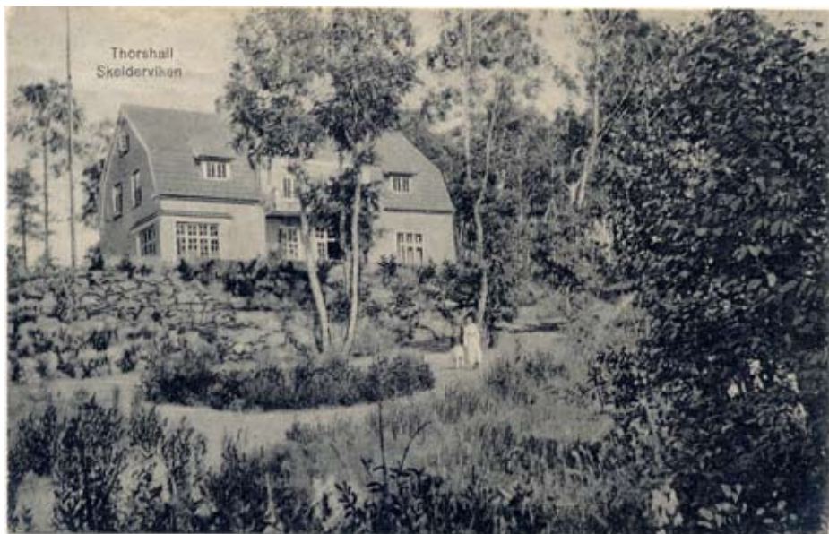
Villa Thorshall vid Lövängsvägen i Skælderviken. En vackert anlagd trädgård sluttar ner till Valhallsvägen.