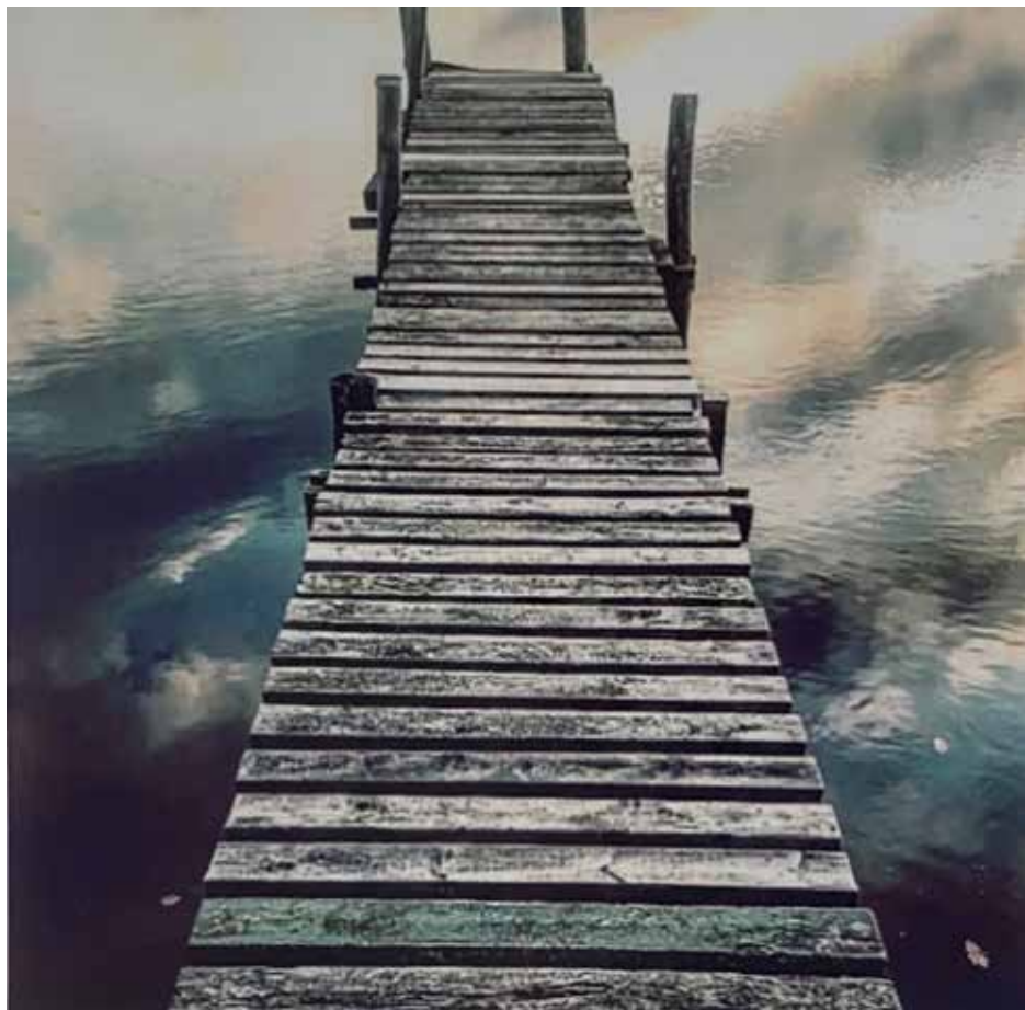
Stairway to heaven en av de 28 bilderna i Fyrhuset

Bilderna till höger är reklamproduktioner som inte är med på utställningen