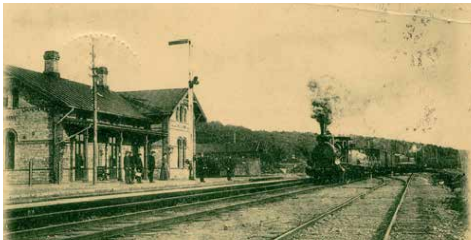
Tåget ångar in på stationen i Engelholms hamn.

På den plats där Skäldervikens station låg fanns före uppförandet 1884 en dansbana, två kägelbanor och en slänggunga, som tillhörde Vårdshuset Hoppet. På området fanns också ett spruthus med brandredskap och två kanoner. Allt fick tas bort för att bereda plats åt stationsbyggnaden och övriga järnvägsbyggnader. 1915 fick stationen en övre våning och stinsen en bostad. 31 maj 1969 gick sista tåget från Skälderviken och 1977 revs stationen.