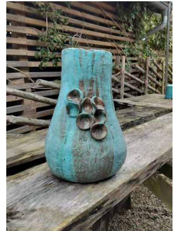
För både ros och ris.