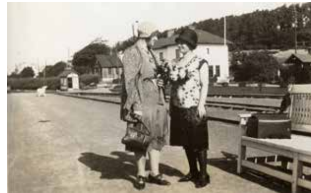
Ett ömt farväl på perro.ngen.