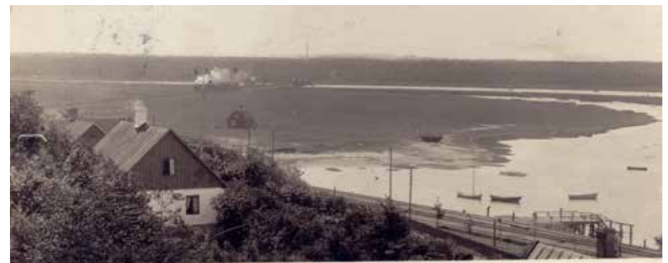
Ångloket kommer tuffande från Ängelholm.